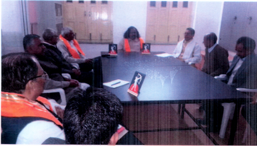
माननीय अध्यक्ष, उदयपुर में वनवासी कल्याण परिषद के प्रमुखजनों से उनकी समस्याओं से रूबरू हुए