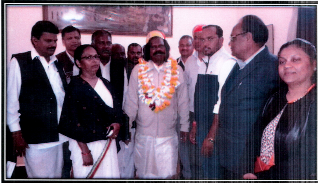
उदयपुर सर्किट हाउस में माननीय अध्यक्ष महोदय विभिन्न संगठन प्रमुखों के साथ