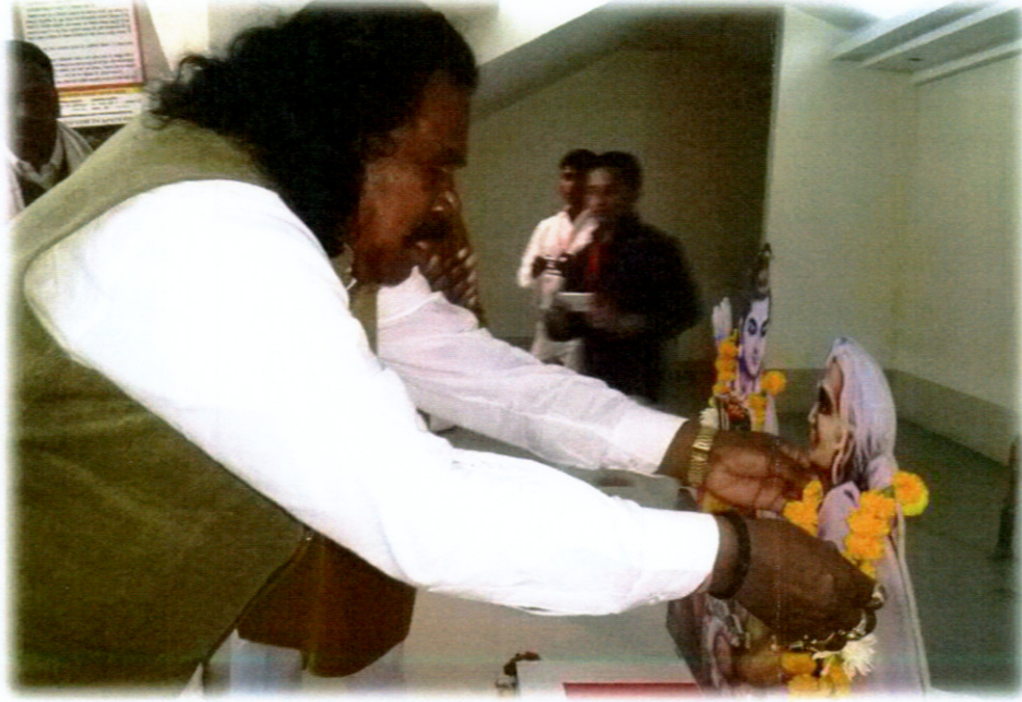
आयोजन से पहले माता सबरी की प्रतिमा पर माल्यार्पण करते माननीय अध्यक्ष

विचार मंच की शुरूआत से पहले जनजातियों ने पारंपरिक तरीके से शोभा यात्रा का भी आयोजन किया था, जिसमें माननीय अध्यक्ष महोदय ने भी सहभागिता की और शोभा यात्रा के संग परिक्रमा में शामिल हुए। इस मौके नन्दुरबार लोकसभा क्षेत्र से सांसद सुश्री हीना गावित भी शोभा यात्रा में शामिल रहीं।