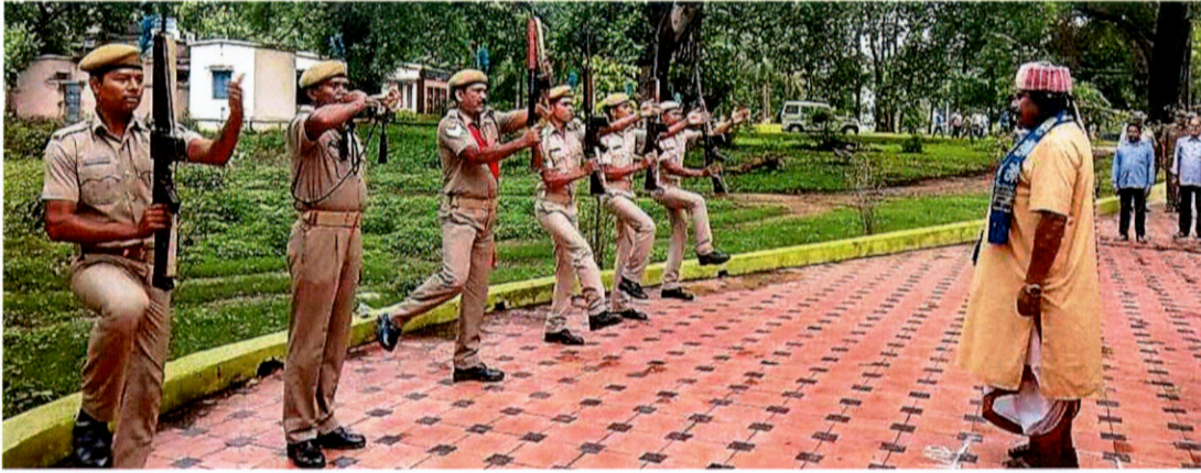
राउलकेला सर्किट हाउस में माननीय अध्यक्ष महोदय को गॉड ऑफ ऑनर दिया गया।

राउलकेला सर्किट हाउस में समाज प्रमुखों और जनप्रतिनिधियों ने माननीय अध्यक्ष के समक्ष स्टील प्लांट की वजह से विस्थापित लोगों की समस्याओं को प्रस्तुत किया। माननीय अध्यक्ष महोदय ने इस संदर्भ में कलेक्टर और संबंधित अफसरों को उनकी समस्याओं के समाधान के लिए निर्देशित किया, साथ ही सड़क व पानी की समस्याओं को भी दूर किए जाने निर्देश दिया।