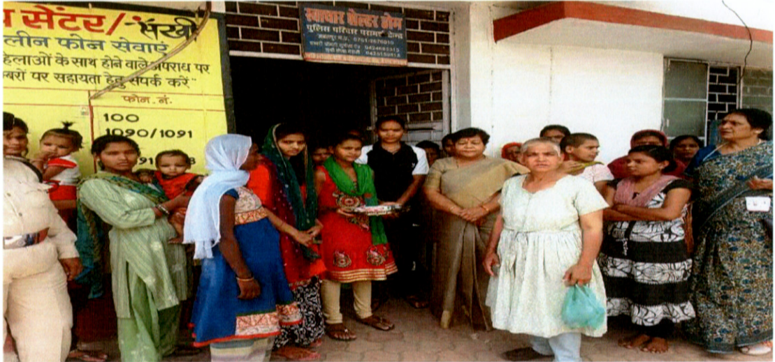
पुलिस परिवार परामर्श केंद्र, जबलपुर का निरीक्षण

माननीय उपाध्यक्ष महोदया द्वारा पुलिस परिवार परामर्श केंद्र, जबलपुर के दौरे के दौरान जाना कि इस सेन्टर का संचालन सवधार होम, जबलपुर, पुलिस लाइन, जेल रोड़ द्वारा किया जाता है। यहां पर उन महिलाओं, बच्चे, लड़कियों को रखा जाता है, जिनको पुलिस लाती है। इस कार्य की देखरेख एक स्वयं सेवी संस्था करती है। इस संबंध में उपाध्यक्ष महोदया ने अनुशंसा की है कि स्वयं सेवी संस्था द्वारा महिलाओं, लड़कियों की देखभाल के लिए संस्था को सरकार द्वारा अनुदान दिया जाना चाहिए।