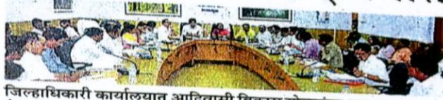
जिल्हाधिकारी कार्यालयात आदिवासी विकास योजनांचा आढावा बैठकीला उपस्थित अधिकारी व मान्यवर.

दुर्गम भागातील आदिवासी बांधवांपर्यंत शासकीय योजना पोहोचाल्यात यासाठी अधिकार्यांनी सचोटीने काम करावे, असे निर्देश राष्ट्रीय जनजाती आयोगाच्या सदस्या माया इवनाते यांनी सोमवारी (दि. १) दिले.