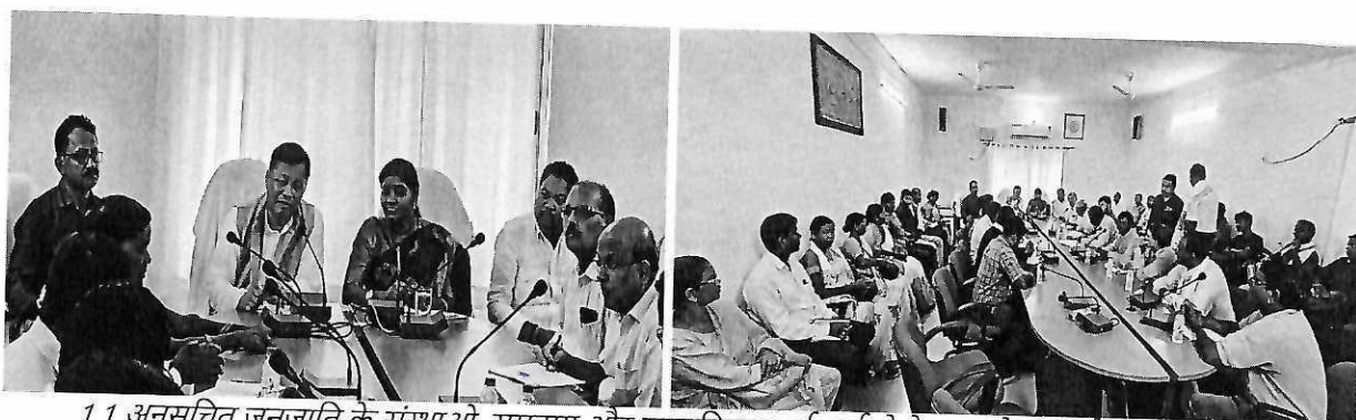
1.1 अनुसूचित जनजाति के संस्थाओं, समुदाय और सामाजिक कार्यकर्ताओं के साथ बैठक आहूत की गई।

दोहपर 12.30 बजे अनुसूचित जनजातियों के कल्याण से संबंधित संस्थाओं के प्रतिनिधियों, जनजातीय समुदायों के प्रतिनिधियों, सामाजिक कार्यकर्ताओं तथा गैर सरकारी संस्थाओं के प्रतिनिधियों के साथ, जिले में निवासरत अनुसूचित जनजातियों की विभिन्न समस्याओं, राज्य सरकार / केंद्र सरकार तथा जिला प्रशासन द्वारा चलाई जा रही विभिन्न कल्याणकारी योजनाओं के कार्यान्वयन, शिक्षा, सवास्थ्य तथा रोजगार से संबंधित प्रकरणों पर चर्चा की। बैठक के प्रतिभागियों की सूची संलग्नक-2 पर है।