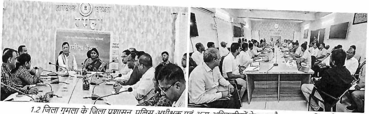
1.2 जिला गुमला के जिला प्रशासन, पुलिस अधीक्षक एवं अन्य अधिकारियों के साथ बैठक आहूत कि गई।

इसके उपरांत सक्षम आधिकारी द्वारा आयोग द्वारा भेजी गयी समीक्षा हेतु प्रश्नावली की सूचना उपलब्ध कराई तथा पॉवर पॉइंट प्रस्तुति के माध्यम से भी अवगत कराया। जिला प्रशासन द्वारा उपलब्ध करायी गयी सूचना में, जिले में अनुसूचित जनजातियों की शिक्षा से संबंधित, छात्रावासों (लड़के एवं लड़कियों), छात्रवृत्ति (Pre-Metric एवं Post-Metric) की जानकारी, कृषि कार्यों से संबंधित जानकारी, जिले में रोजगारों की स्थिति, जनजातीय वित्तीय निगम विभाग, जिला परिषद् द्वारा किये जा रहे कार्य (जिनमे आवास एवं भूखंड का आबंटन), रसद विभाग द्वारा दिए जा रहे कार्य, चिकित्सा विभाग, उपायुक्त कार्यालय द्वारा किये जा रहे कार्य, जिला पुलिस द्वारा किये जा रहे कार्य, महिला एवं बाल विकास विभाग, टी.ए.डी/ वन विभाग/ राजिविका, सहकारी समिति खनिज विभाग द्वारा किये जा रहे कार्यों की जानकारी प्रस्तुत की परंतु आयोग द्वारा जिले के सभी विभागों से अनुसूचित जनजाति से संबंधित योजनाओं और उनका आवंटन से सम्बंधित आकड़ों के बारे में सूचना मांगी गई जिसके ऊतर में किसी भी विभाग ने अनुसूचित जनजाति से सम्बंधित विस्तृत आकड़े आयोग के समक्ष प्रस्तुत नहीं किये।